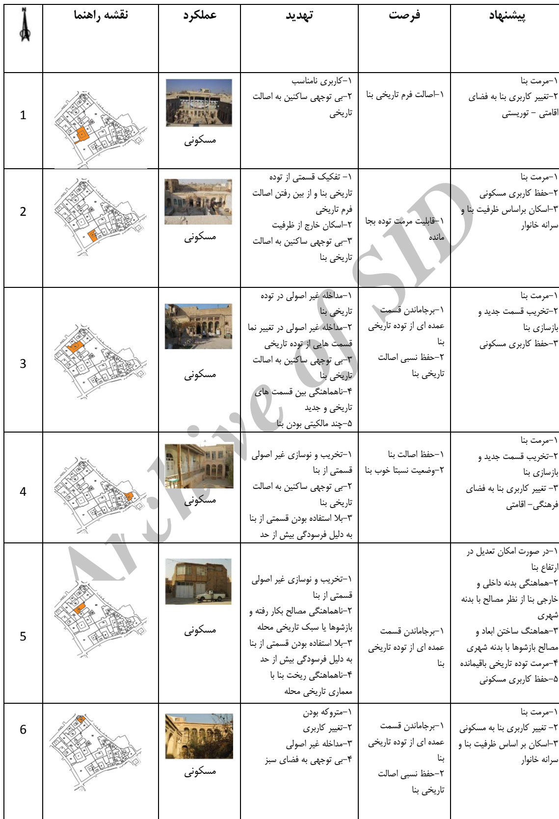
جدول ۹. تحلیل نقاط ضعف و قوت بنا